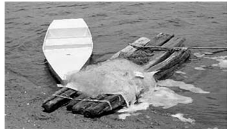
les enfants sinistrés. L'action consiste à financer des centres de formation

Porté par l'association culturelle franco-indienne, Vidyalaya, le projet favorise la reprise d'activités économiques et sociales en Inde, en partenariat avec l'association locale Pondy-Pêcheurs (installée à Pondichéry). Il comporte des volets économique, social et éducatif, pour soutenir les pêcheurs, les femmes et