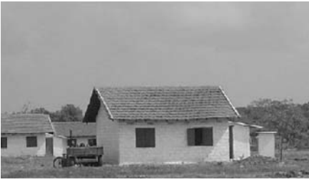
Modèle des maisons qui seront reconstruites à Thalayadi (Sri Lanka).

Les 3 et 20 juin derniers, les membres du Collectif Solidarité Asie se sont réunis pour analyser et sélectionner des actions de reconstruction dans les pays touchés par le raz-de-marée du 26 décembre 2004.