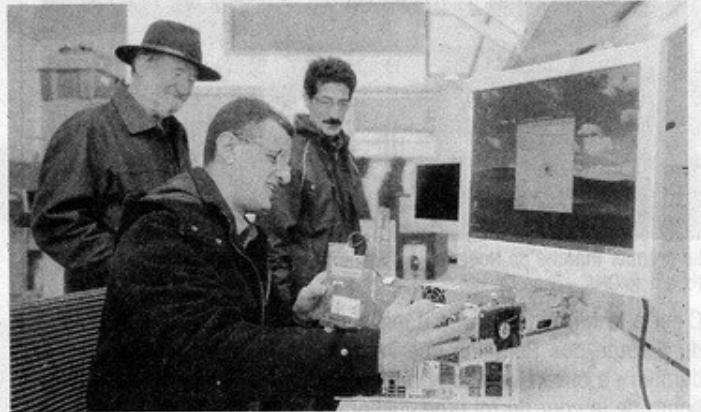
Des salariés du chantier d'insertion informatique, en compagnie du président d'Humanis, Michel Steinecker, l'homme au chapeau, dans les nouveaux locaux de l'association, rue du Héron, à Schiltigheim.

D'autre part, Carijou devrait installer en janvier prochain son activité de récupération de jouets chez Huma-