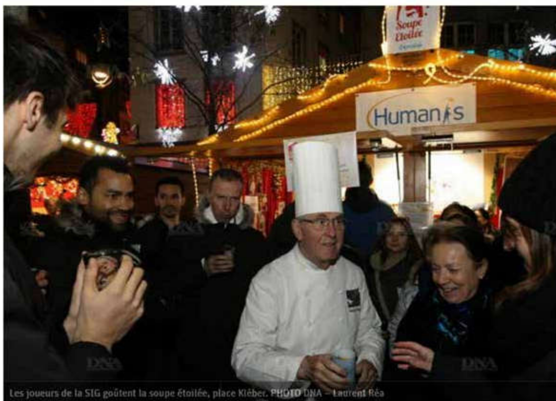
Les joueurs de la SIG goûtent la soupe étoilée, place Kléber.

Juste après leur entraînement, les joueurs de la SIG et leur entraîneur Vincent Collet se sont rendus place Kléber pour soutenir et prendre part au projet de la « Soupe étoilée ».