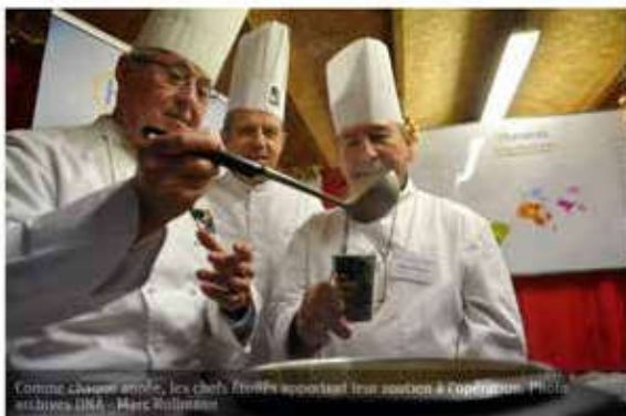
Comme chaque année, les chefs apportent leur soutien à l'opération.

Pour la 4 e édition, le Village du partage va accueillir le collectif Humanis et « La Soupe Étoilée » : un véritable challenge gastronomique et solidaire pour financer les salariés en insertion et divers projets. Quatre chefs de renom, quatre recettes inédites de qualité pour un moment de partage et de fraternité.