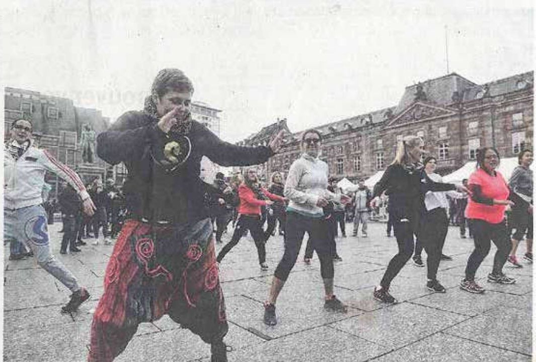
Danser pour la solidarité internationale, place Kléber.

Durant l'après-midi, les musiques se succèdent, dans la partie de la place Kléber qu'occupent les associations. Au chanteur solitaire succède une orchestration tonitruante, qui accompagne une zumba du développement. Une dizaine de pratiquantes se réchauffent sur