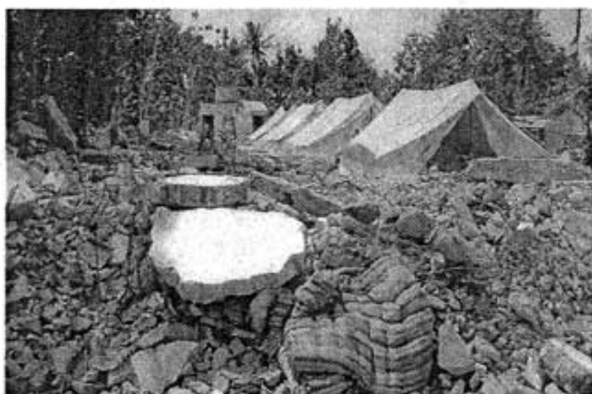
La délégation d'Humanis s'est rendue à l'épicentre du séisme. Ici, des bâtiments et une école détruits dans la province de Jogjakarta. Le relogement se fait en urgence sous tente. En attendant les pluies torrentielles. (Doc. remis)

□ 1 150 VÊTEMENTS DE PLUIE. - Rencontres avec les populations et les structures partenaires (Secours islamique), et visites de sites (notamment d'écoles détruites dans les villages du secteur) ont jalonné leur mission « d'identification des besoins émergents ». Il s'est avéré très vite qu'il fallait protéger très concrètement les populations de la pluie : des fonds