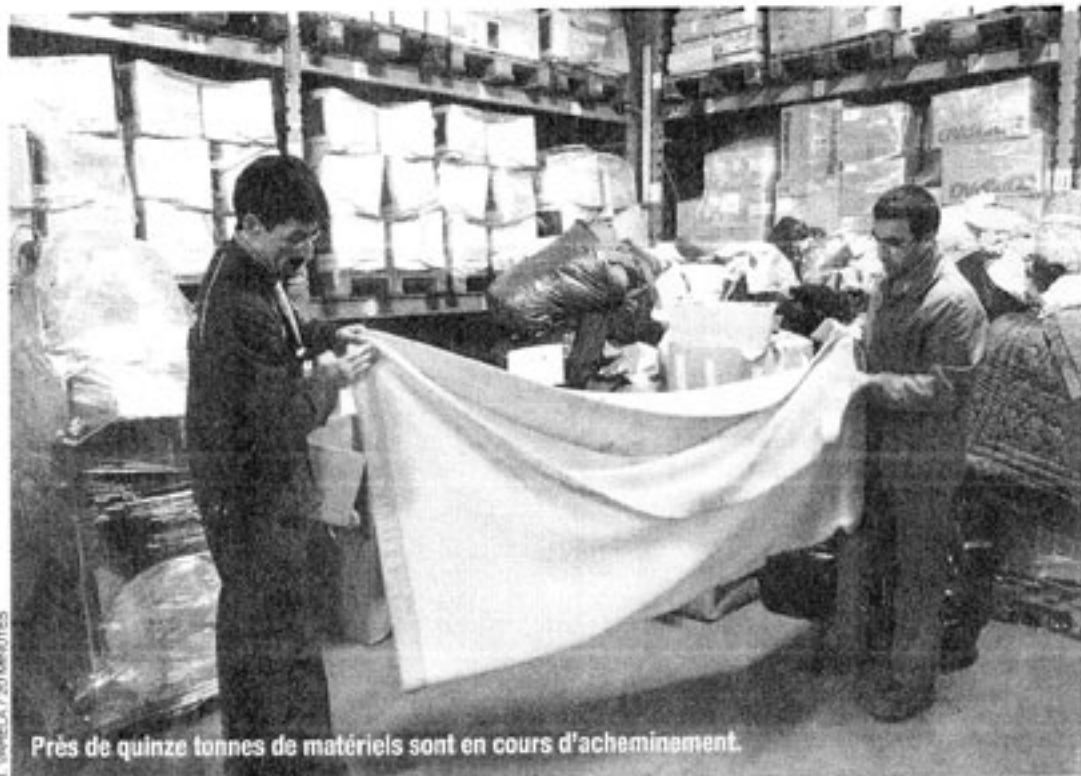
Près de quinze tonnes de matériels sont en cours d'acheminement.

Une aide matérielle fournie par plusieurs associations humanitaires, parmi lesquelles Action contre la faim et, dans une moindre mesure, Handicap International. Pour répondre au mieux aux besoins des populations sinistrées, Humanis ne se contente pas d'acheminer le matériel : « Trois représentants bénévoles partent ce samedi au Cachemire Pakistanais. Leur mission est de s'assurer sur place de l'arrivée du conteneur et de veiller à ce que l'aide soit bien distribuée là où elle doit l'être », souligne Sabine Franco, chargée de mission chez Humanis.